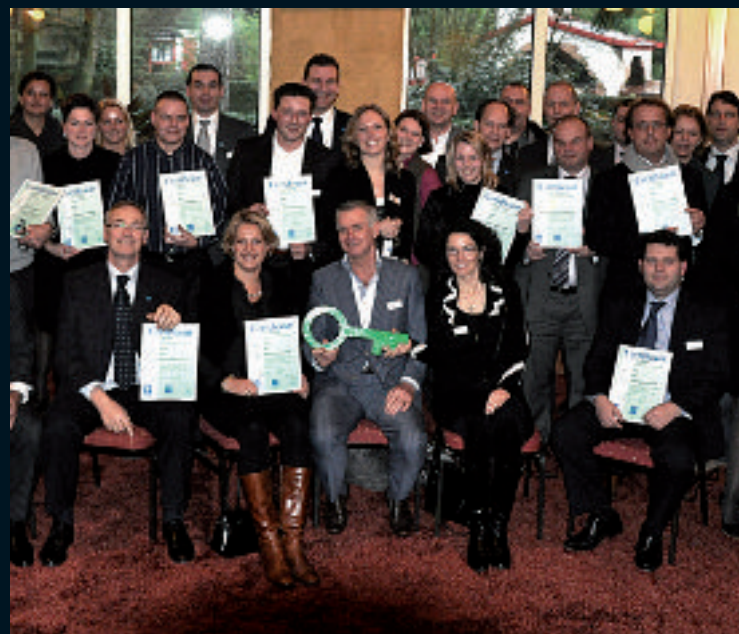
Uitreiking Green Key Goud certificaten